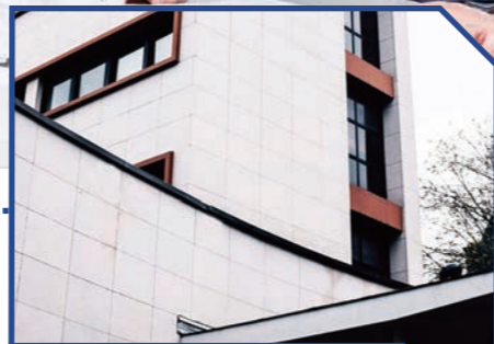
サッシ施工の現場